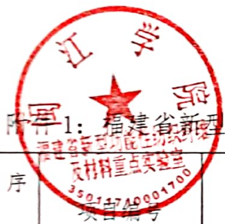
附件1: 福建省新型功能性纺织纤维及材料重点实验室2017年度开放基金项目结题情况名单