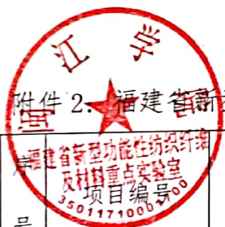
附件 2. 福建省新型功能性纺织纤维及材料重点实验室 2018 年度开放基金项目结题情况名单